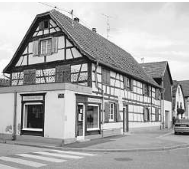
L'ancienne forge rouvre demain à Kertzfeld.

A Kertzfeld, au début du siècle dernier, une forge trônait à l'angle des rues du Général Leclerc et de Stotzheim. Après la cessation de l'activité du fer, ces murs ont été transformés en local commercial.